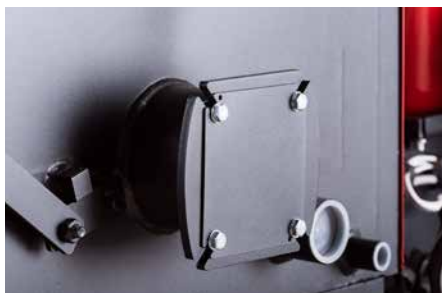
Brucciatore biocombustibile (predisposizione)