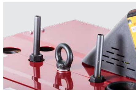
Dissipatore di potenza residua (integrato)

Il silo di stoccaggio combustibile da 190 litri è provvisto di sensore capacitivo che assicura lunghe autonomie di funzionamento (per un'efficienza maggiore vedi soluzioni di stoccaggio).